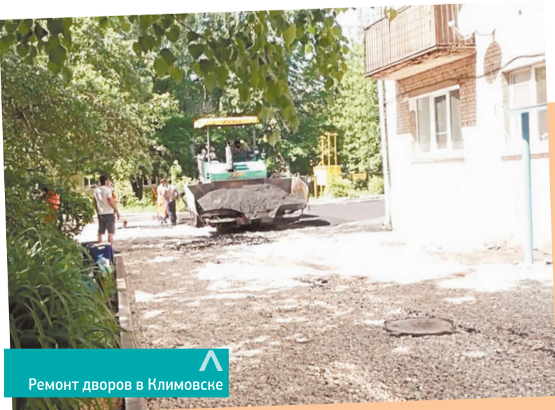
Ремонт дворов в Климовске