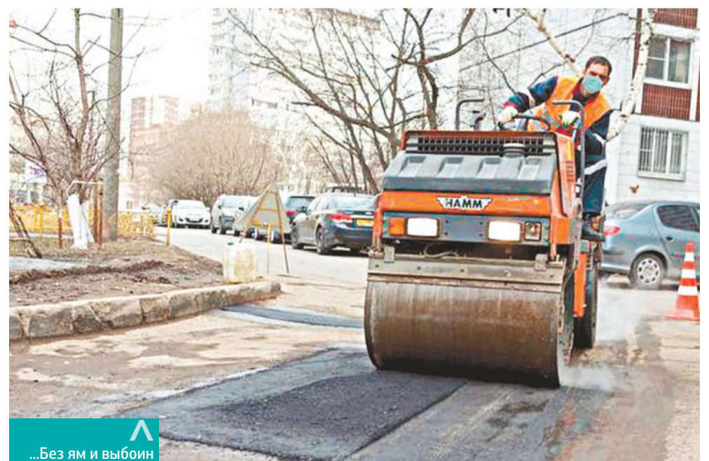
...Без ям и выбоин