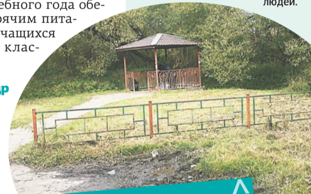
Родник в Валищево: было – стало