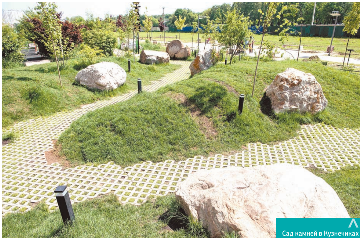
Сад камней в Кузнечиках

«Сад камней» в Кузнечиках – новое крупное общественное пространство округа, обустроенное по инициативе жителей