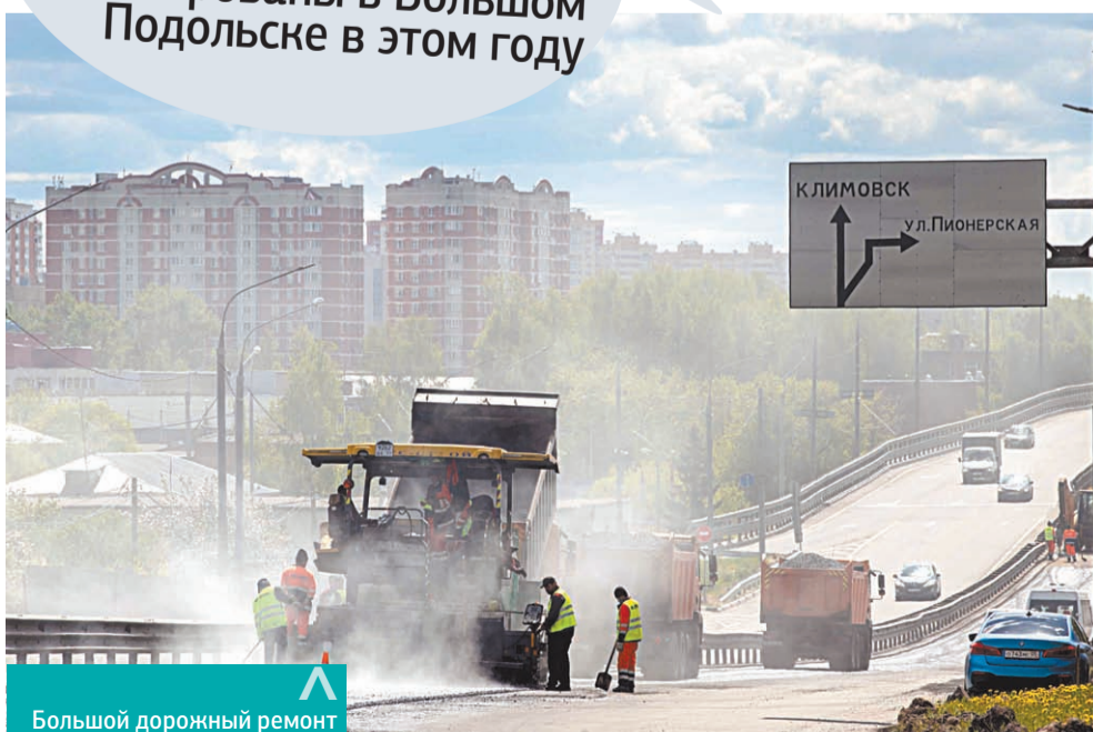
Большой дорожный ремонт

54 муниципальных дороги будут отремонтированы в Большом Подольске в этом году