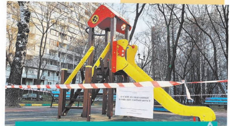
Закрытие детских площадок – временная мера. Когда режим самоизоляции закончится, можно будет снова гулять с друзьями.

Сотрудники школ и организаций питания соблюдают все меры предосторожности.