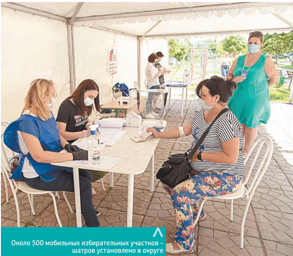
Около 500 мобильных избирательных участков – шатров установлено в округе