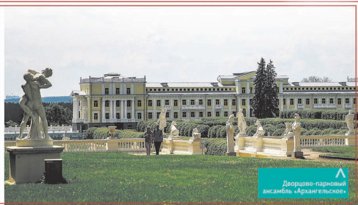
Дворцово-парковый ансамбль «Архангельское»