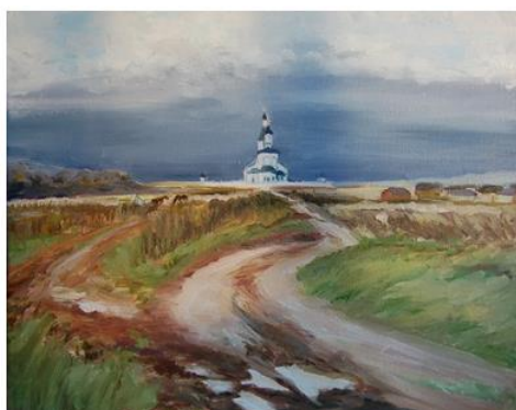
Живописные работы Татьяны Трубниковой