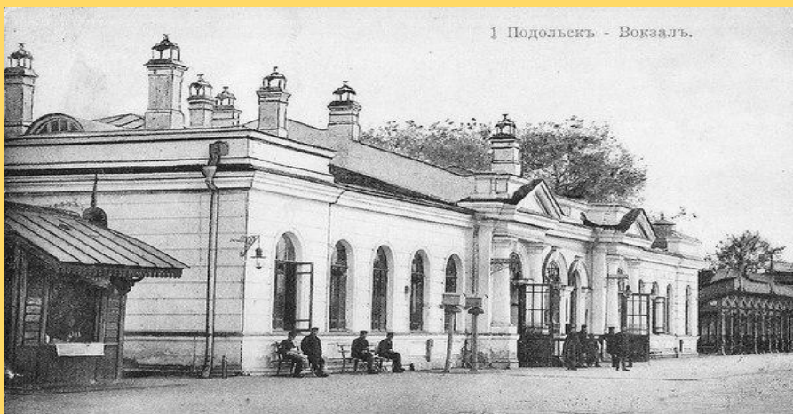
Подольский железнодорожный вокзал. - 1889 г.