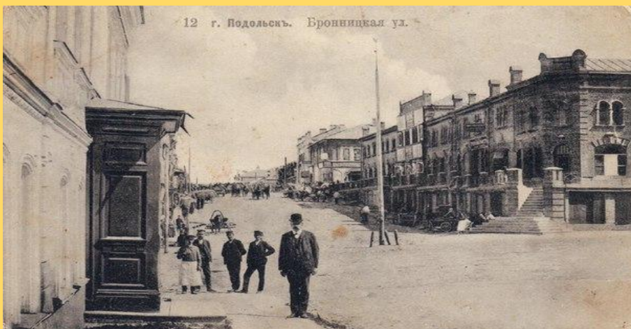
Бронницкая улица (Ревпроспект). – 1900-1915 гг.