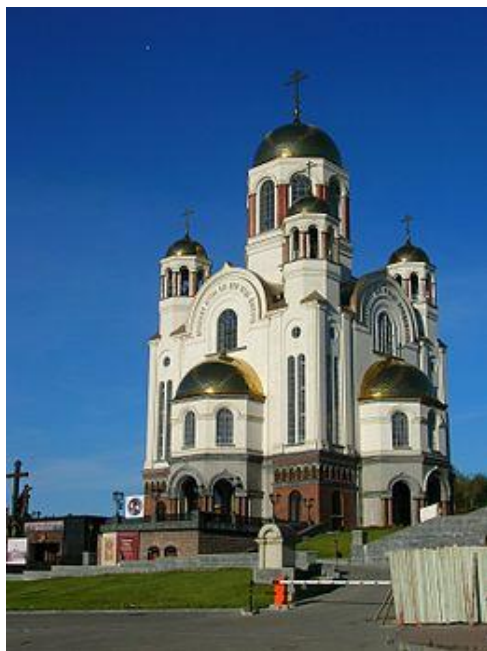
Храм-Памятник на Крови во имя Всех святых, в земле Российской просиявших в Екатеринбурге

19.10(1.11).1981 года Николай II, его семья и их сопровождающие были прославлены Российской православной церковью (РПЦ) как великомученики.