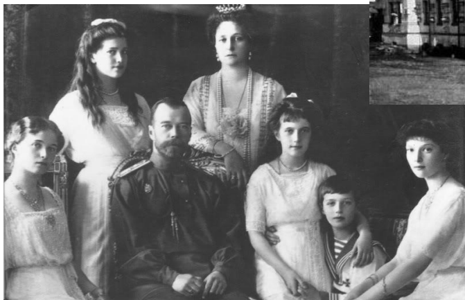
Портрет семьи Николая II