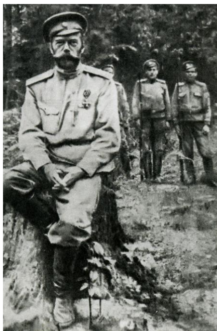
Арестованный Николай II. На прогулке (фото)

Столыпин : на пути к Великой России : [с надеждой на Бога и царя] / Д. Струков. – М : Вече, 2012. – 318с. : ил.