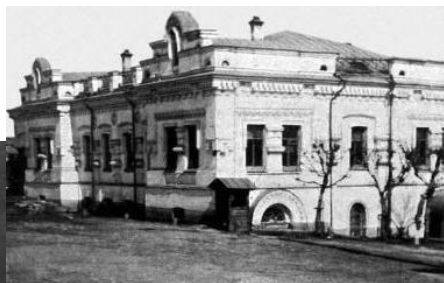
Дом Н. Н. Ипатьева

2 (15) марта Николай II подписывает отречение от престола. После отречения император был объявлен арестованным. 9(22) марта он прибыл из Могилёва в Царское Село, где воссоединился с семьёй. Первоначально семья не собиралась покидать Россию, намереваясь жить в Крыму, но вскоре выразила готовность оставить страну. 10(23) марта в ответ на запрос Милюкова британское правительство ответило согласием на переезд царской семьи в Великобританию, однако уже 10(23) апреля отменило своё решение. 1(14) августа Временное правительство отправило бывшего императора и его семью в Тобольск, объяснив это заботой об их безопасности.