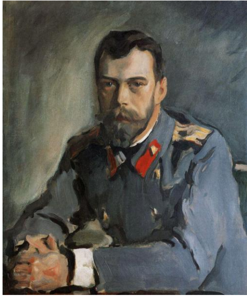
Император Николай II. Портрет работы В. А. Серова. 1900