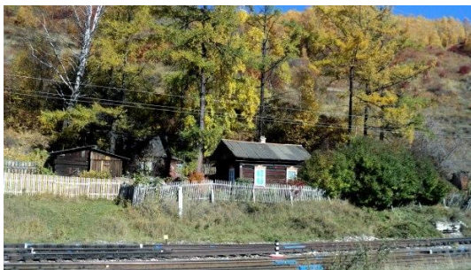
Домик В. Г. Распутина у берега Байкала