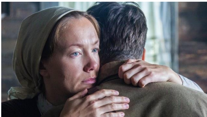
Кадр из фильма "Живи и помни" (Настёна – Дарья Мороз)

2008 — «Живи и помни» - режиссёр Александр Прошкин.