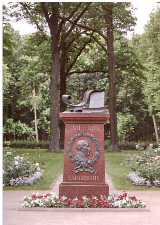
Первый памятник, открытый в Остафьеве

В 1911 году трудами последнего владельца Остафьева – историка и государственного деятеля, графа С.Д. Шереметева возле остафьевского дворца был воздвигнут памятный знак, приуроченный к столетней годовщине написания Карамзиным «Записки о Древней и Новой России» - ярчайшего публицистического документа начала XIX столетия. Но венчали постамент с барельефом историка, окаймлённого лавровым венком, бронзовые тома его «Истории».