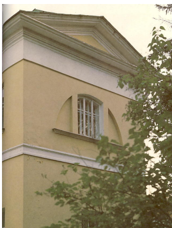
Главный усадебный дом в Остафьево. Окно комнаты Н. М. Карамзина

Святылище истории / М. Щербакова // Земля Подольская. – 2010. – 30 сент. – С.28 : ил.