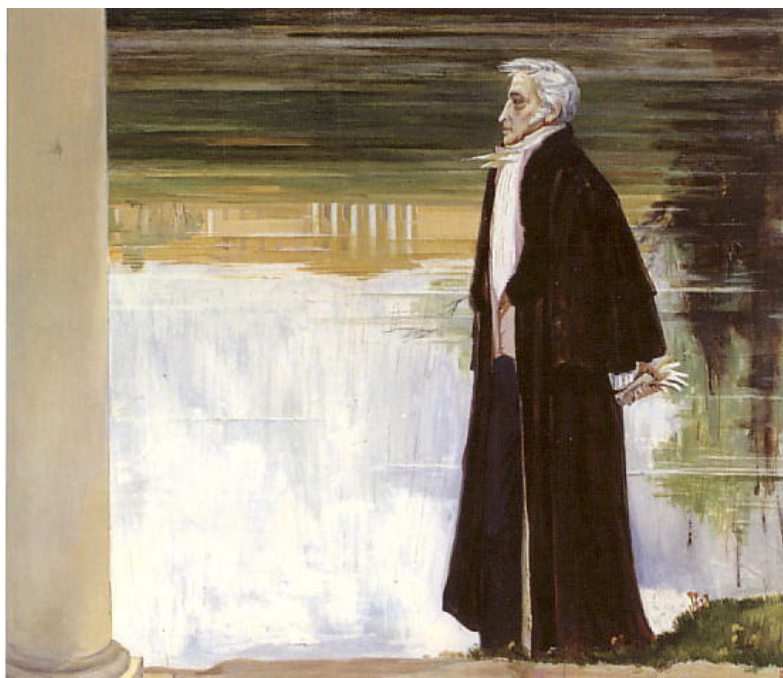
Л. Давыдова. Портрет Карамзина. 1989

«Остафьево достопамятно для моего сердца: мы там наслаждались всею приятностию жизни, не мало и грустили; там текли средние, едва ли не лучшие лета моего века, посвящённые семейству, трудам и чувствам общего доброжелательства в тишине страстей мятежных...»