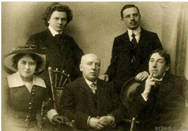
1 ряд :А.Чеботаревская, Ф.Сологуб, И.Северянин; 2 ряд: В. Баян, Б. Богомолов. 1913 год.