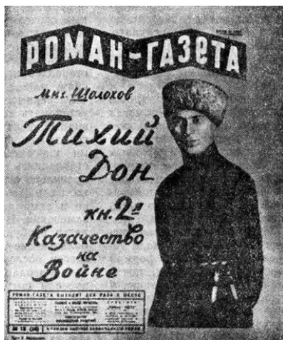
Одно из первых изданий "Тихого Дона" 1929 г., тираж: 3млн экземпляров

(об истории создания романа и мифов вокруг него)