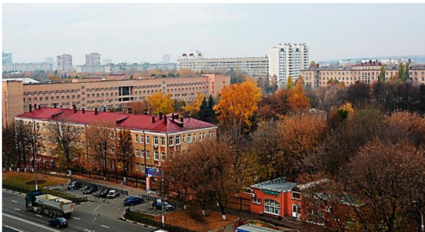
Подольская городская клиническая больница (Современный вид больничного комплекса)